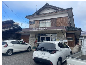
②集合場所(2日目)の外観