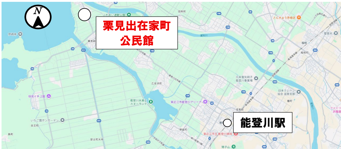
図 能登川駅～現地見学場所への経路