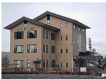
①集合場所(1日目)の外観